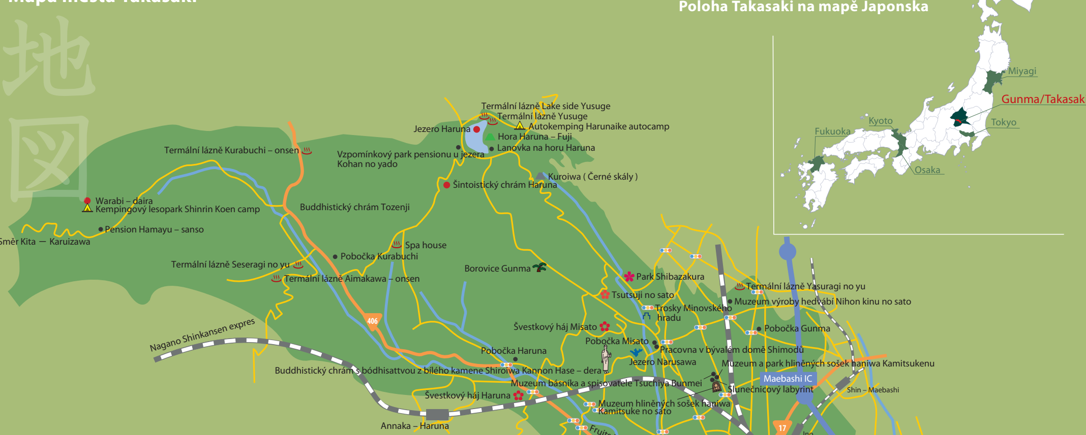
Poloha Takasaki na mapě Japonska