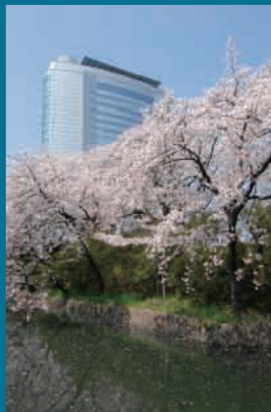
Informace jsou platné k lednu 2008

Adresa: Takamatsu - cho 35-1, Takasaki PSC:370-8501 Tel: 027-321-1257 E-mail: kankou@city.takasaki.gunma.jp http://www.city.takasaki.gunma.jp